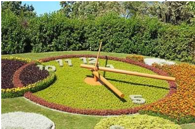
Основной вклад англичан в развитие ландшафтного дизайна –это газон.