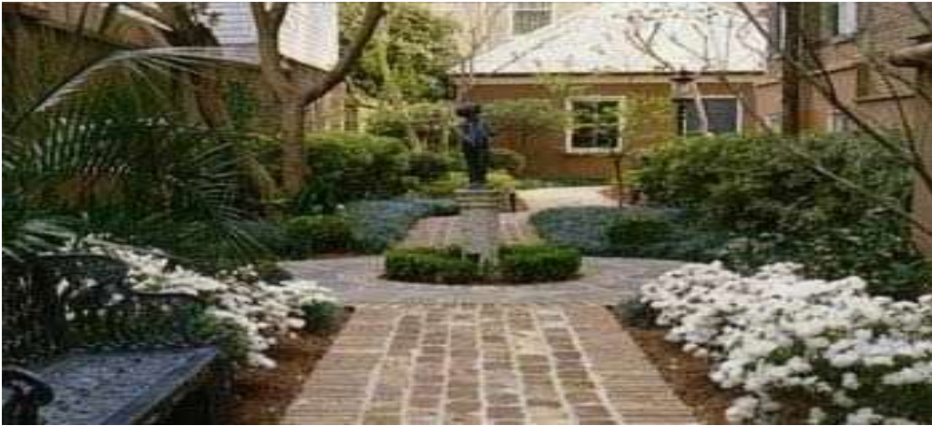
Там, где есть один англичанин будет сад.